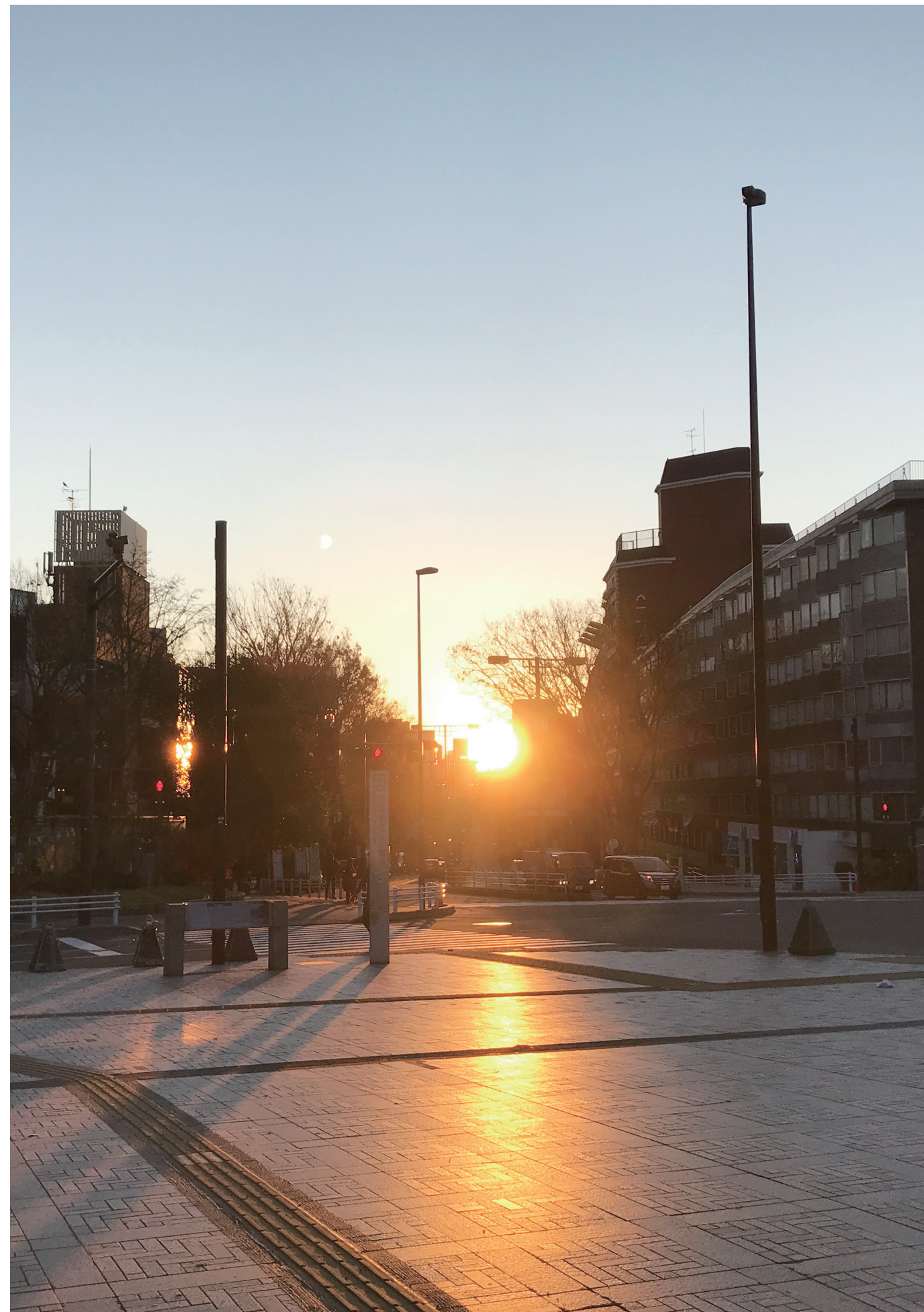
明治神宮 五輪橋から撮影した冬至の日の出（冬至の日に表参道から日が昇る）