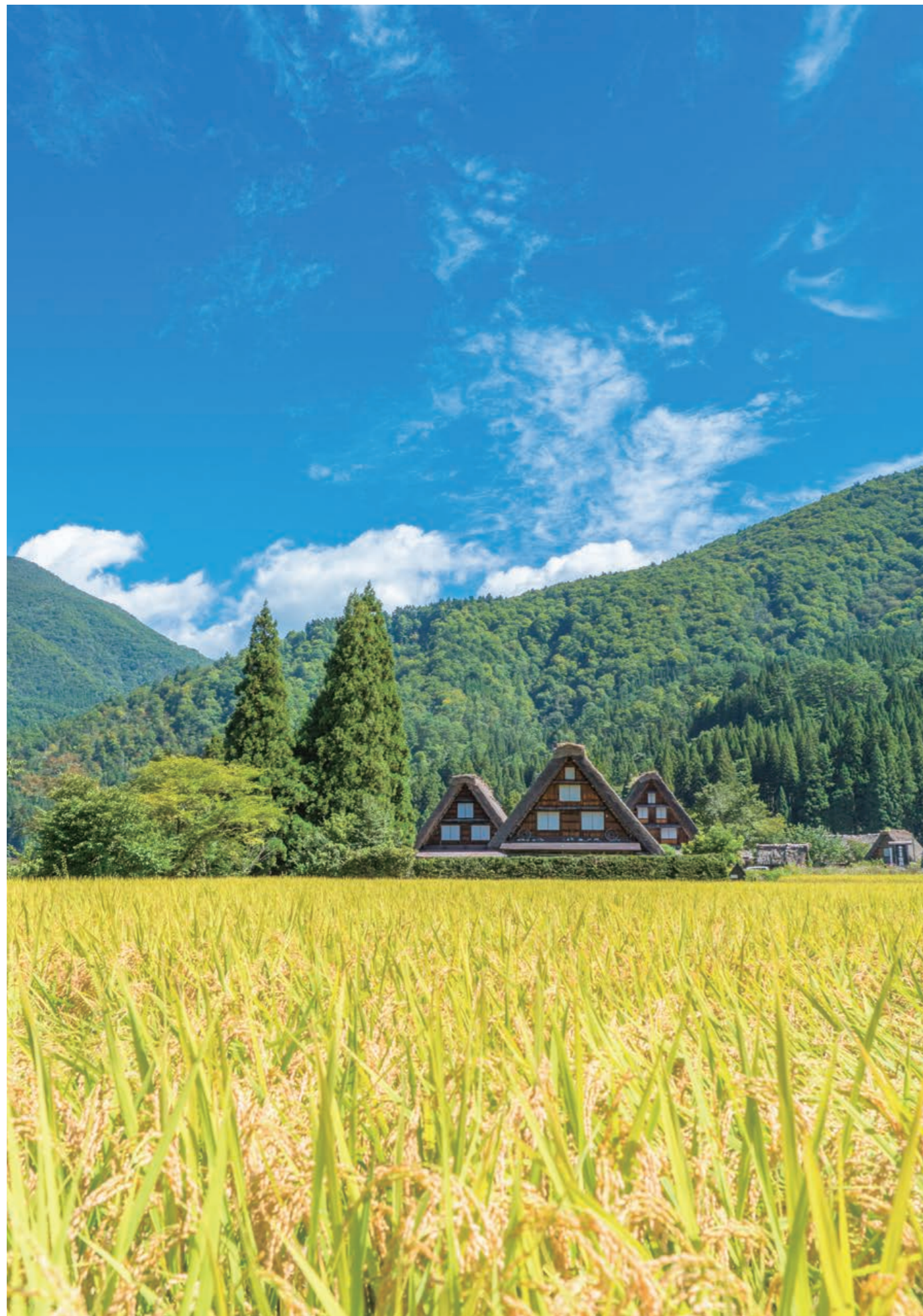
撮影場所：白川郷（岐阜県）