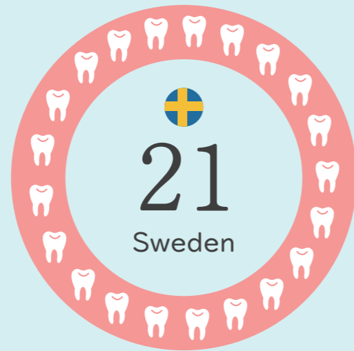
出典：平成 17 年歯科疾患実態調査 Thirty year trends in the prevalence and distribution of dental caries in Swedish adults (1973-2003)