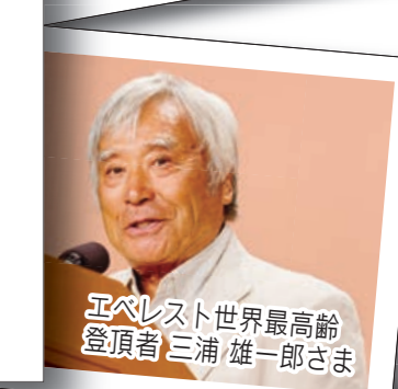
エベレスト世界最高齢 登頂者 三浦 雄一郎さま