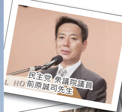
民主党 衆議院議員 前原誠司先生