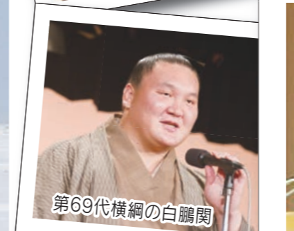
第69代横綱の白鵬関