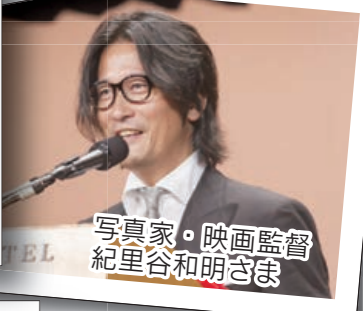
写真家・映画監督 紀里谷和明さま