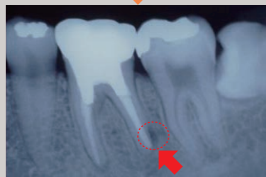
根管治療後10ヶ月のレントゲン写真では、病変は縮小されていました