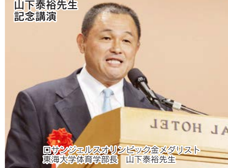
回サンジェルスオリンピック金メダリスト 東海大学体育学部長 山下泰裕先生