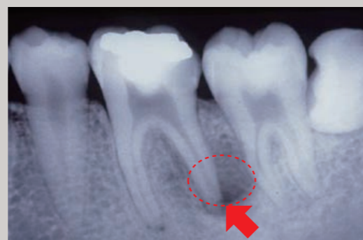
治療前のレントゲン写真では、大きな病変(顎の骨が破壊されている)の存在が見られました