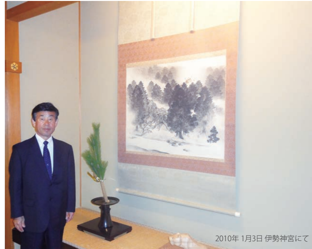
2010年 1月3日 伊勢神宮にて