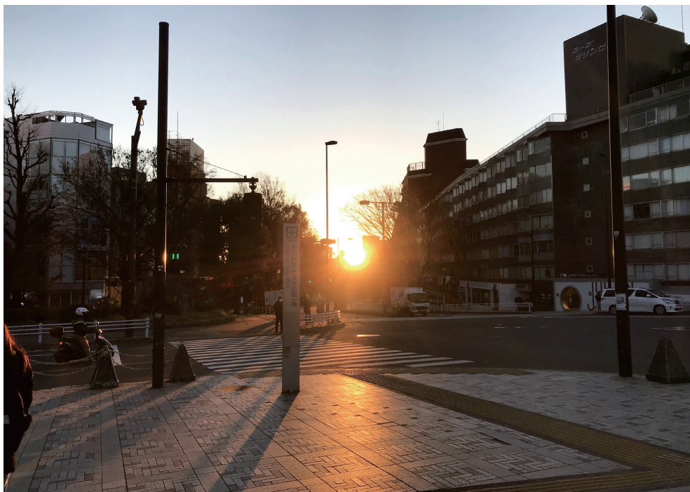
東京 表参道 / 冬至の日の出